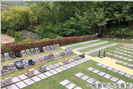
一般墓地(芝生墓地)