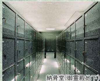
納骨堂(御霊殿地下)